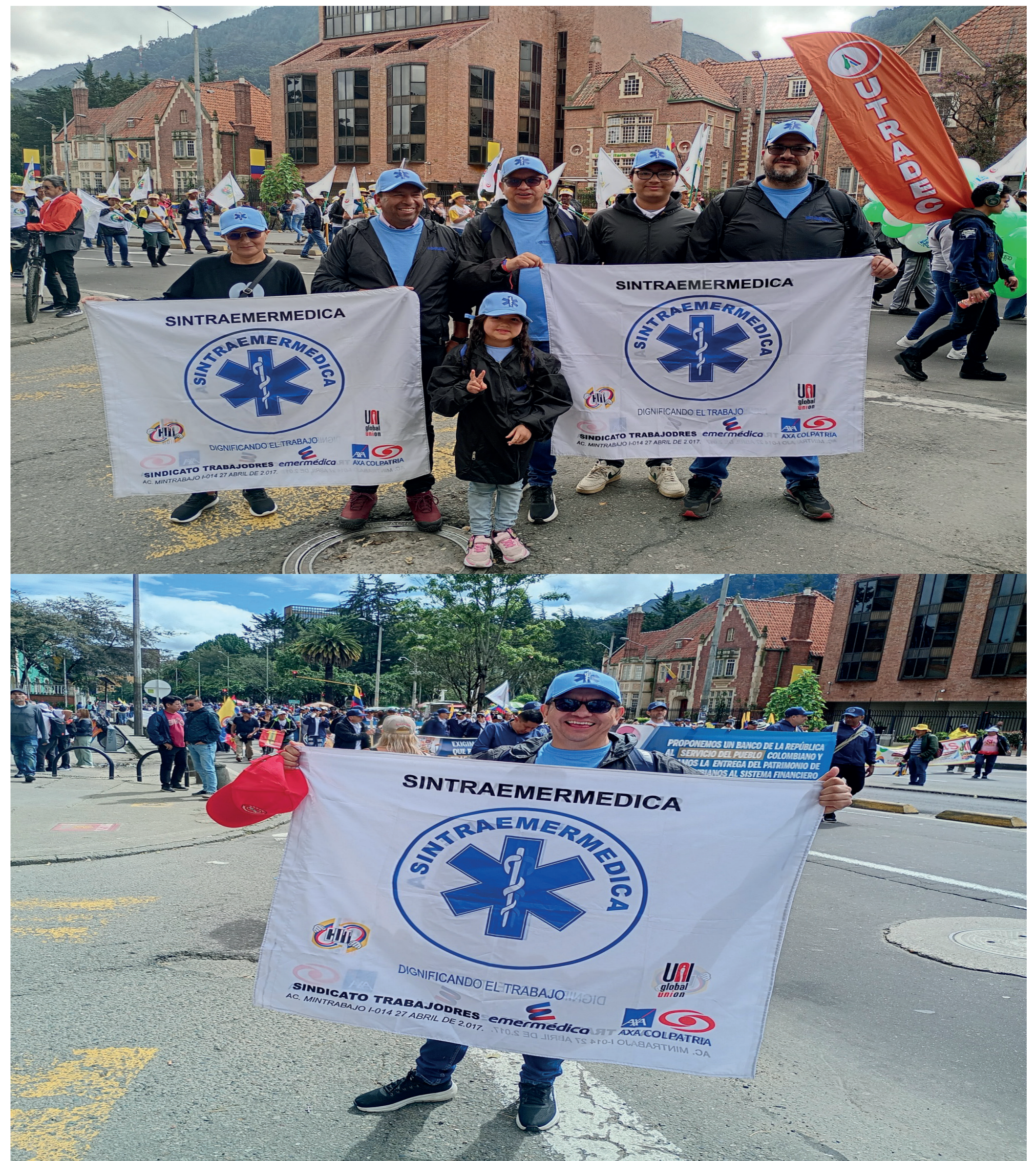
Imágenes de archivo Sintraemergencia.