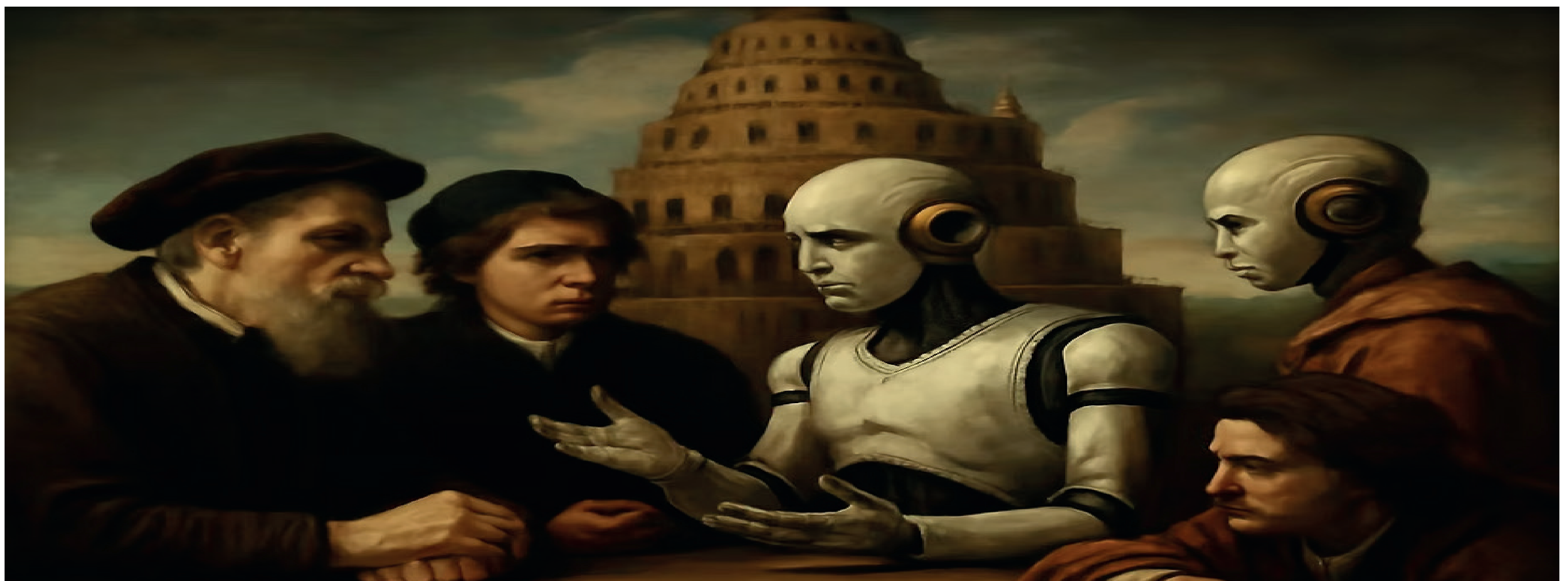
La Crisis del Lenguaje: El Vacío del Mundo y el Encuentro que lo Salva Imagen: Landscape.

La comunicación auténtica, el encuentro genuino con el otro, es lo que puede devolverle al hombre el sentido perdido de su existencia. Solo a través del lenguaje vivido, del diálogo, de la intersubjetividad, podemos restaurar el mundo y reconstruir el sentido que da forma a nuestras vidas.