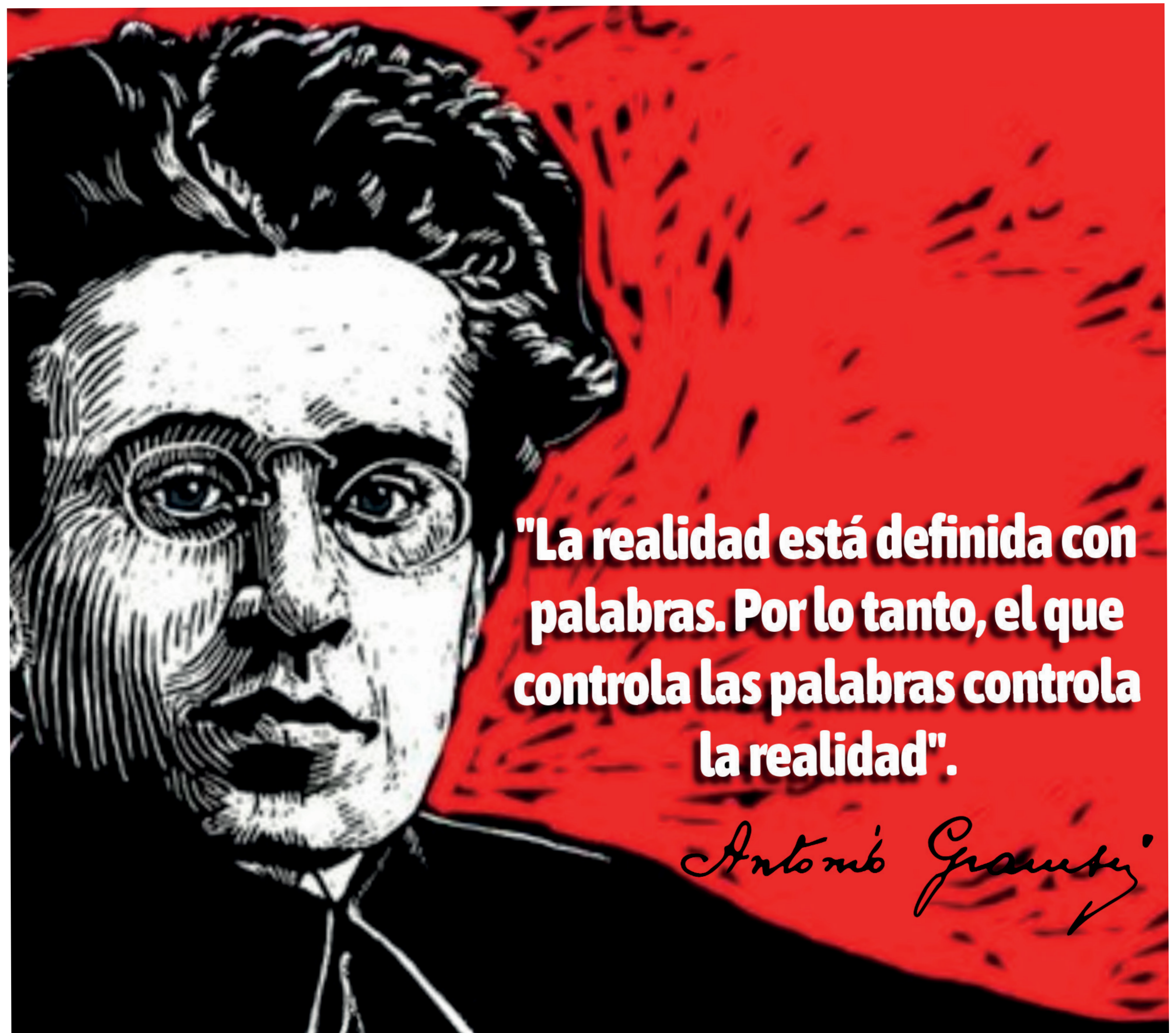
Imagen: Frase de Gramsci. Ilustración: Erika Lara - Dpto Comunicaciones.

Si permitimos que quienes detestan la igualdad hablen en nombre del pueblo, ya hemos perdido. No por las urnas, sino por las palabras. Y entonces el silencio no será una metáfora: será nuestra tumba.