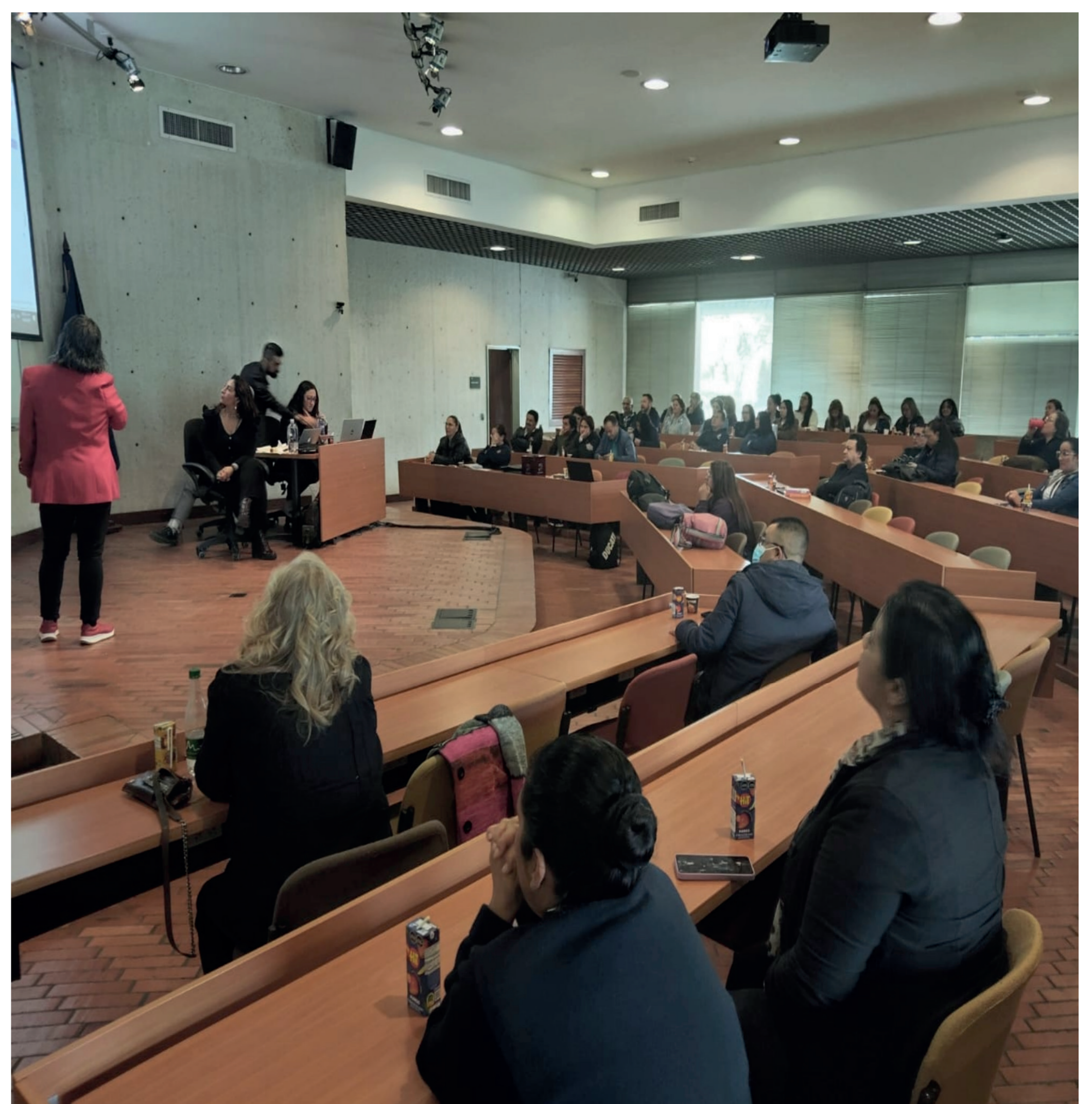
Asamblea Sintratadeo.

Es por ello, que la comunicación entre los negociadores y la base sea clara y oportuna para eclipsar el radio pasillo y la desinformación malintencionada como táctica de desorientación, desmotivación y conflicto interno que pueda ser utilizada para debilitar el proceso.