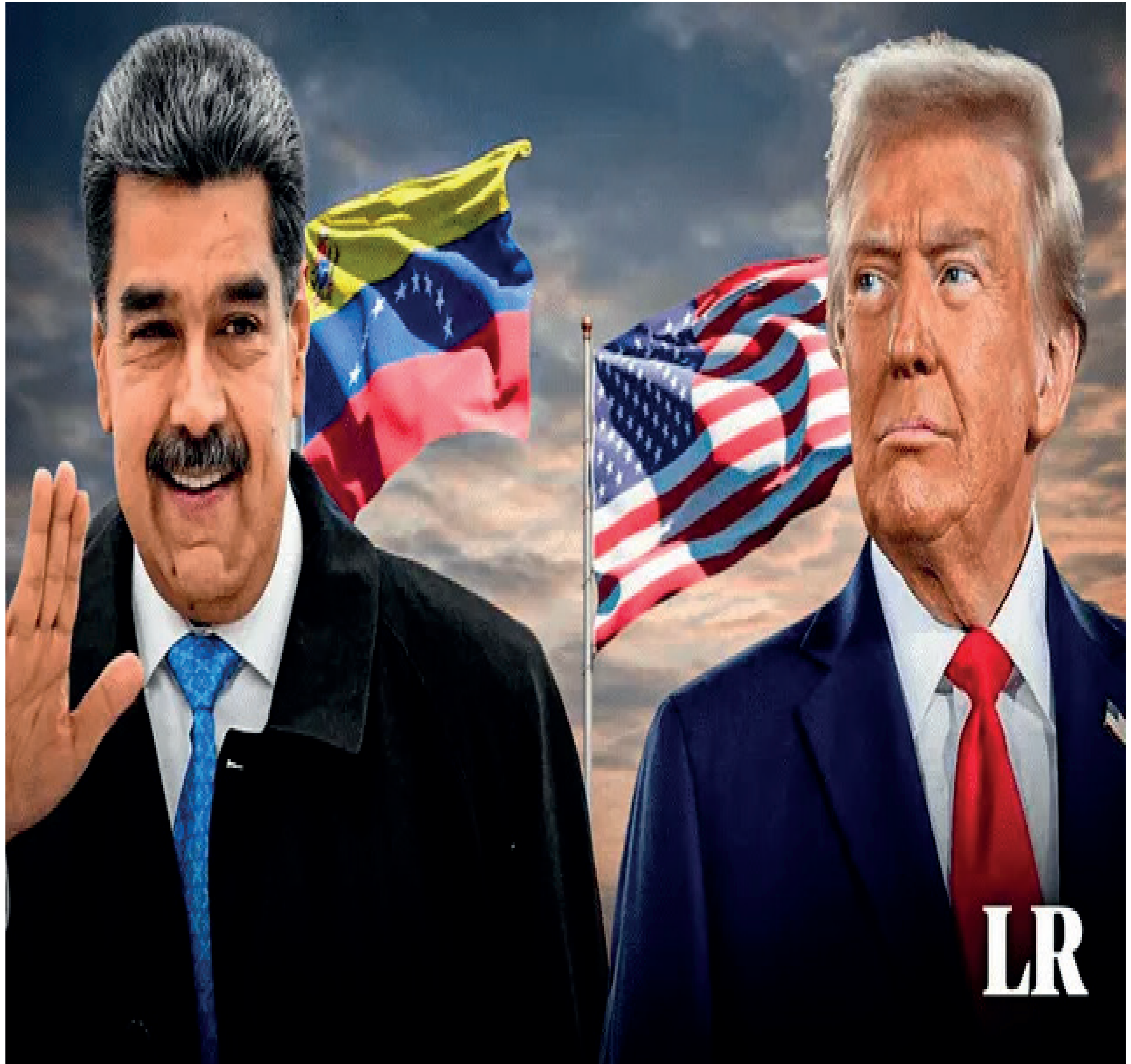
Maduro VS Trump.

Al encontrarse frente a una multilateralidad creciente, incapaz de afrontar al mismo tiempo sus déficits gemelos (fiscal y comercial) y su pretensión de omnímodo gendarme global, ha decidido escenificar cuatro hipótesis de conflicto bélico, priorizando los enfrentamientos contra China, los BRICS+, los países rebeldes del denominado Hemisferio Occidental (especialmente Cuba, Venezuela) y los migrantes internos, identificados como narcotraficantes y criminales. La designación de estas cuatro guerras está indisolublemente ligada a causalidades geoeconómicas y políticas.