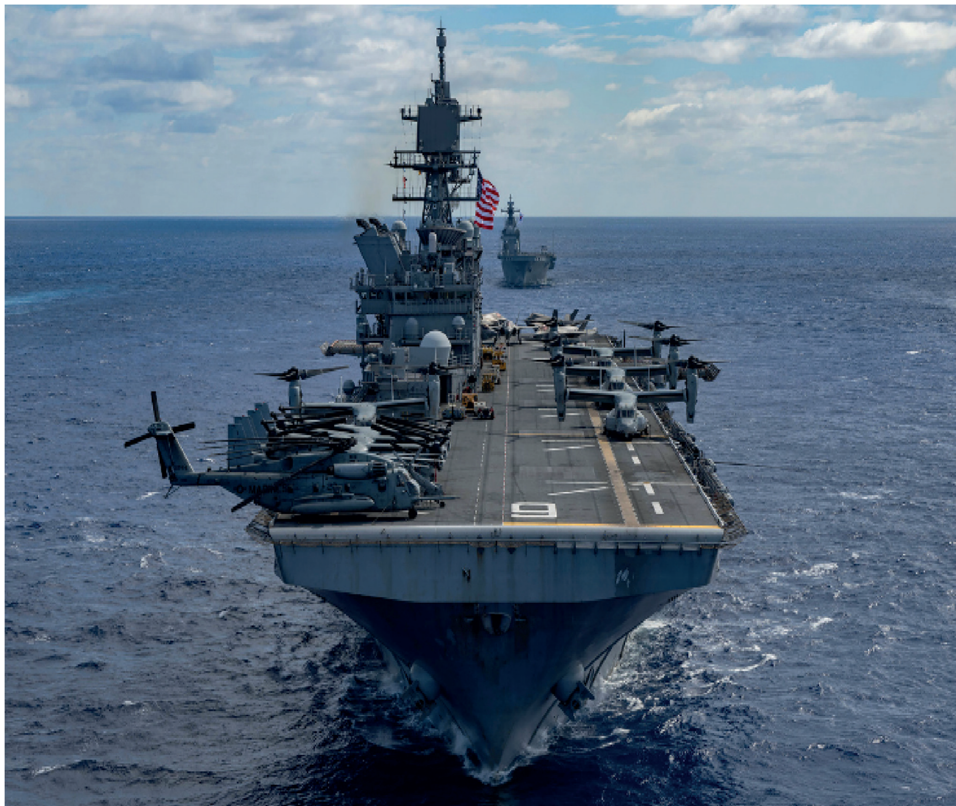
Buques de la Marina de Guerra de los Estados Unidos.

En el caso de nuestro vecino chavista, de acuerdo a la óptica de analistas locales, Estados Unidos profundiza su ofensiva contra Venezuela: no le bastan las sanciones económicas que desde hace años golpean a la población del vecino país; ahora ofrece millones de dólares a quien proporcione 'información' sobre Maduro. En realidad, el objetivo que se quiere es incentivar abiertamente el intervencionismo o golpes de Estado al servicio de los intereses norteamericanos.