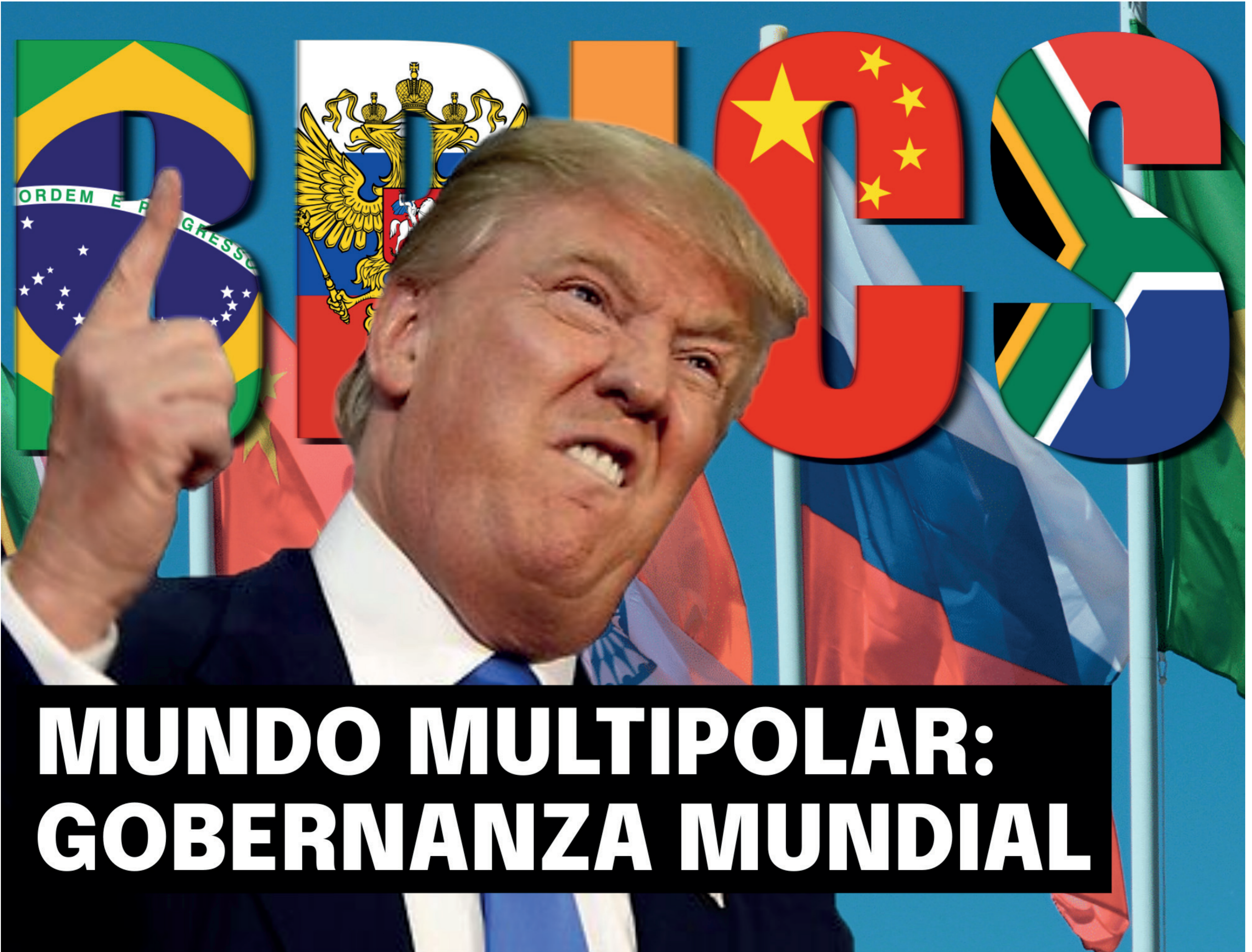
Imagen: Trump enojado con los líderes del BRICS Ilustración: Erika Lara - Dpto Comunicaciones.

M ientras el gobierno de turno de EE. UU. intenta imponer su dominio imperial mediante la práctica del miedo bélico y la presión económica —léase incremento de aranceles—, otros gobiernos optan por fortalecer la integración entre países vecinos y establecer alianzas entre semejantes para hacer frente a las crisis derivadas de un modelo en decadencia. El desazón de este neofeudalismo, tanto de EE. UU. como de la OTAN, es evidente: se engañan a sí mismos para sostener la farsa de una posesión colonialista en continentes como África, Asia y América, mientras países como Brasil, Rusia, India, China y Sudáfrica se integran en el foro de los BRICS. A su vez, otros Estados solicitan de manera voluntaria unirse, atraídos por los beneficios que representa pertenecer a esta estructura o, al menos, por el respaldo que brinda frente a las dificultades económicas, políticas y tecnológicas que persisten tras siglos de sometimiento al norte global.