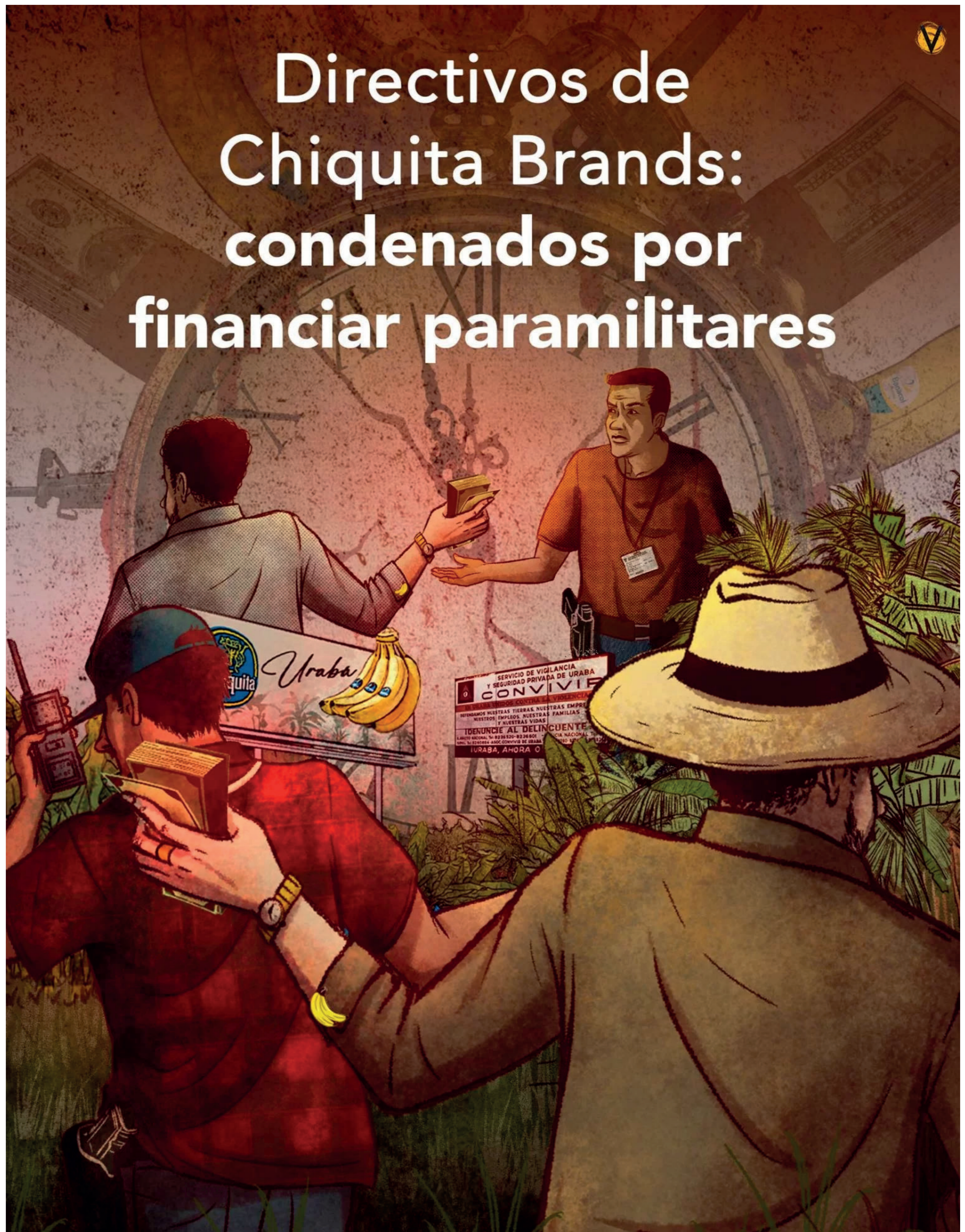
Reportaje Chiquita Brands por Vorágine.

A medida que avanzó la investigación, fue quedando claro el mecanismo de financiación empresarial a las AUC: los empresarios entregaban tres centavos de dólar a las Convivir de Urabá, y estas, fundadas, controladas e integradas por paramilitares,