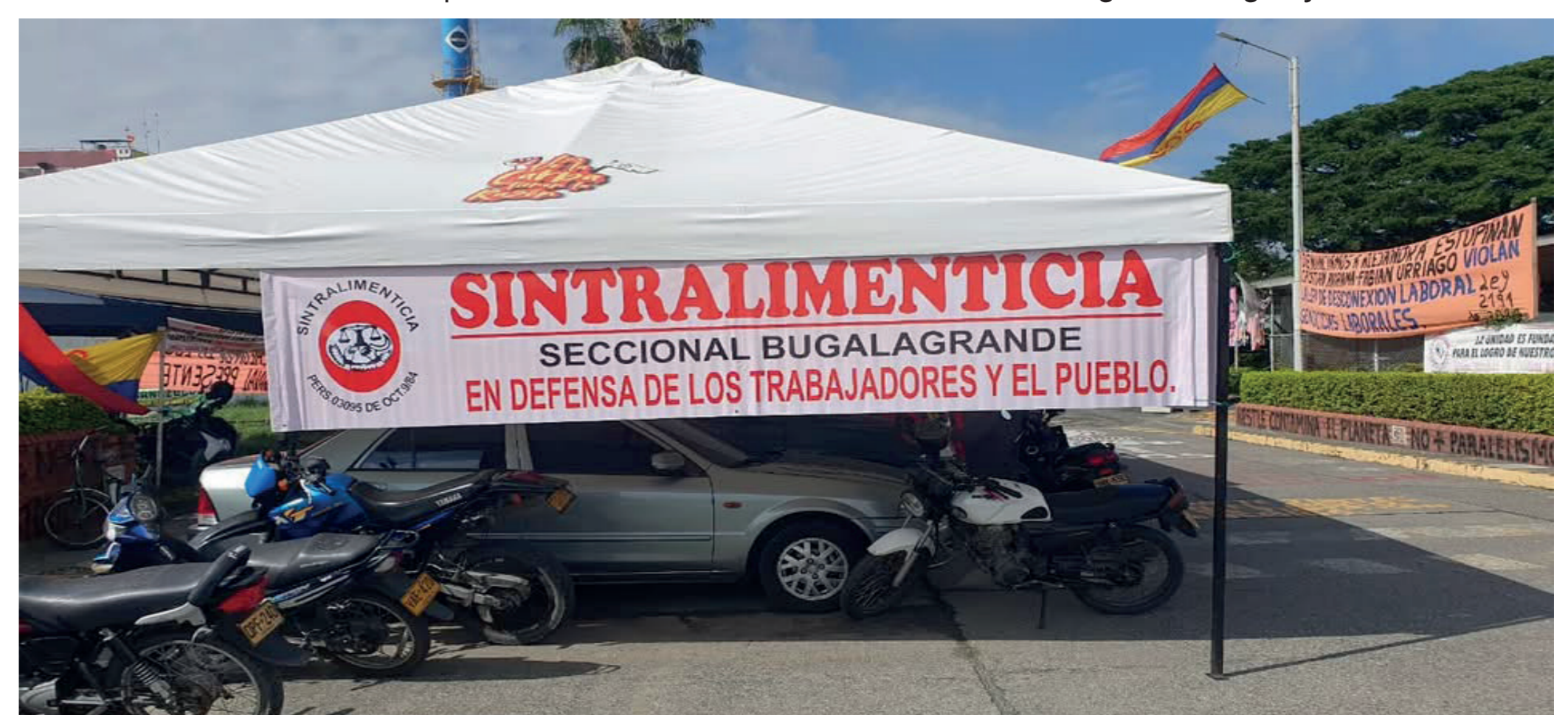
Pancarta Sintralimenticia.

En la sentencia se ha reconocido que Sintralimenticia no es una maniobra de recuperación de espacios de Sinaltrainal, es una expresión organizativa legal, constitucional, presionada por la restricción que los testaferros de Nestlé han hecho contra la representación sindical.