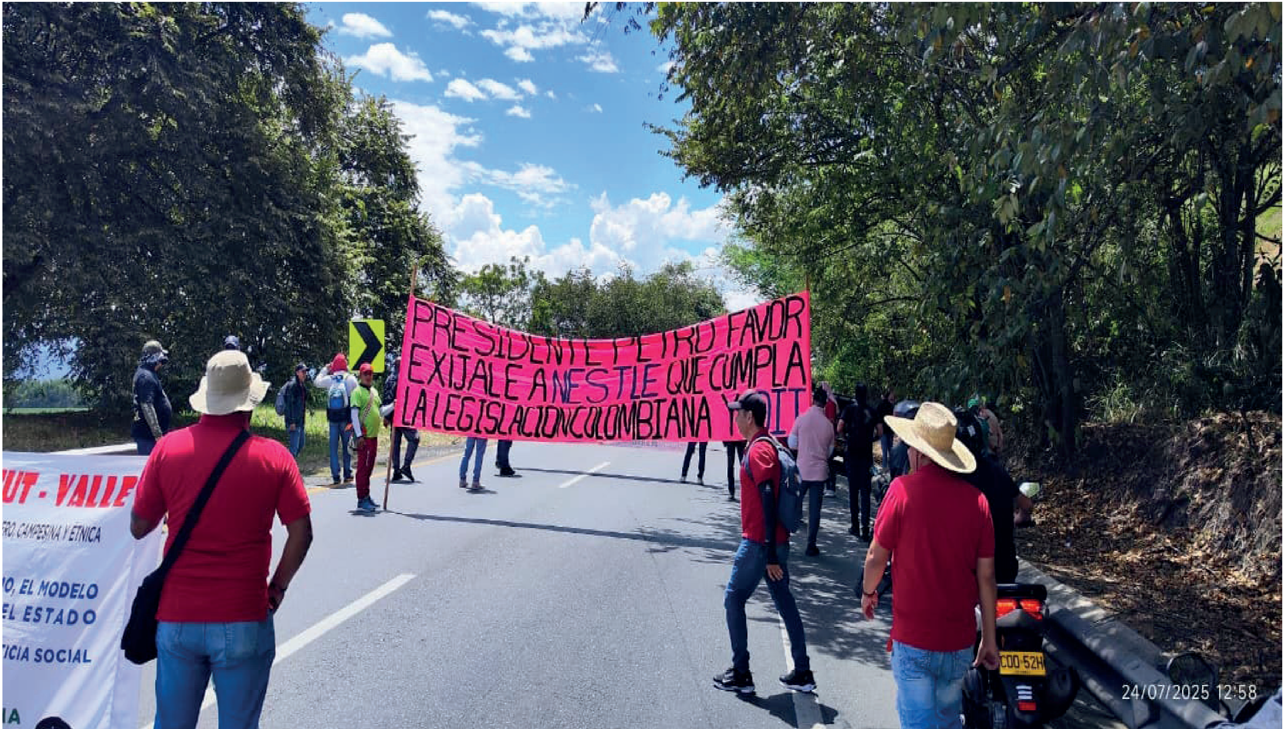
Protesta trabajadores Sintralimenticia.