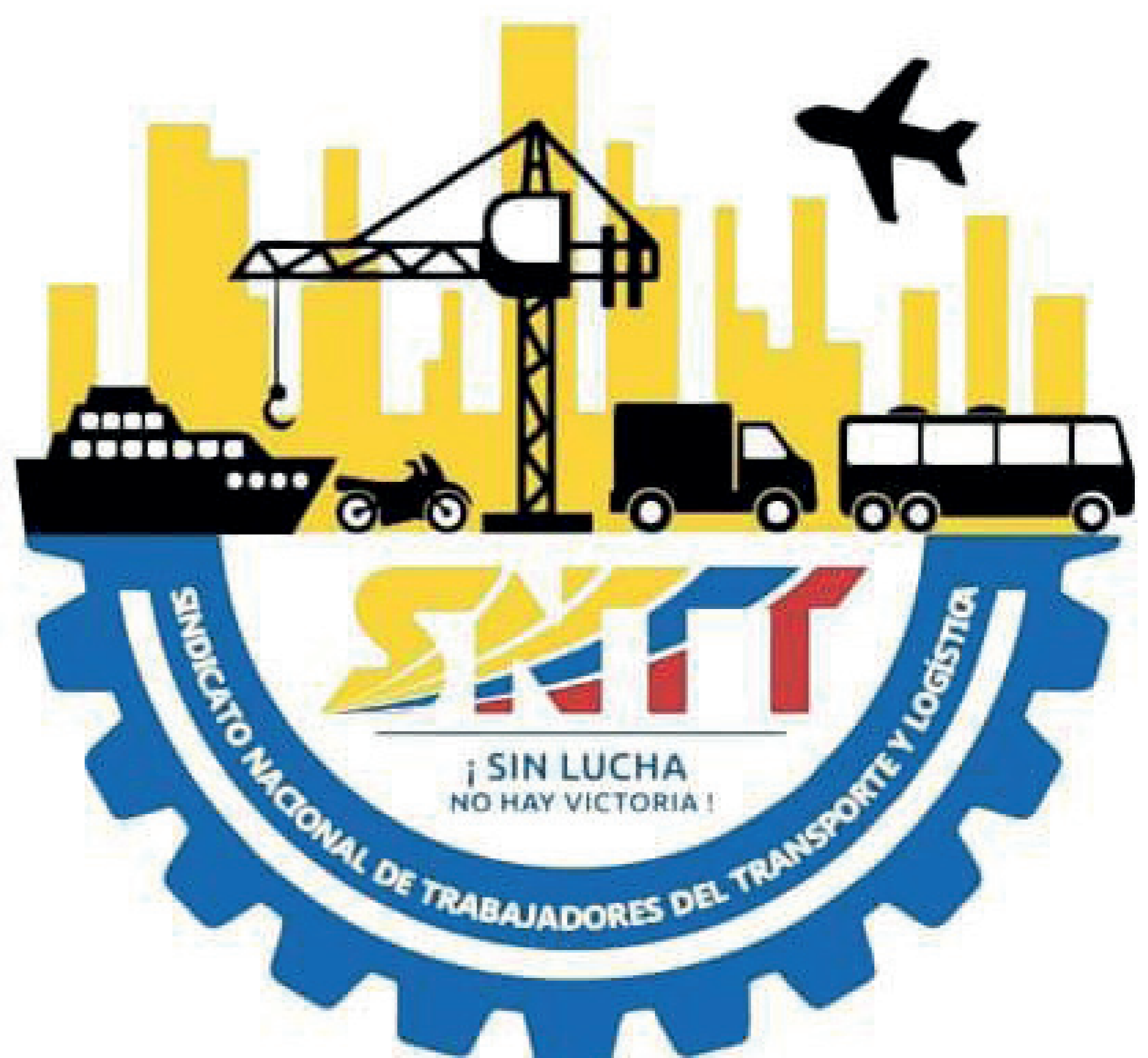
Logo oficial SNTT.

Parte del comunicado oficial de SNTT Tocancipá.