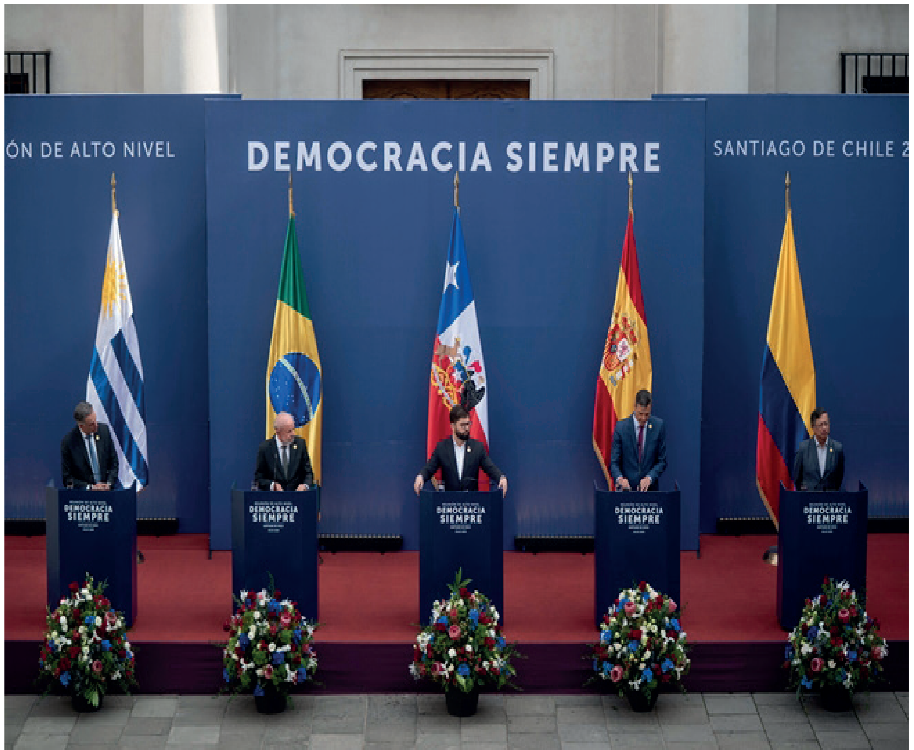
Declaración de los Presidentes de Chile, Brasil, España, Uruguay y Colombia tras la reunión de Alto Nivel “Democracia Siempre”, realizada en el Palacio de La Moneda.

pública y ciudadana y hacer frente a los discursos de odio, la desinformación y la intolerancia.