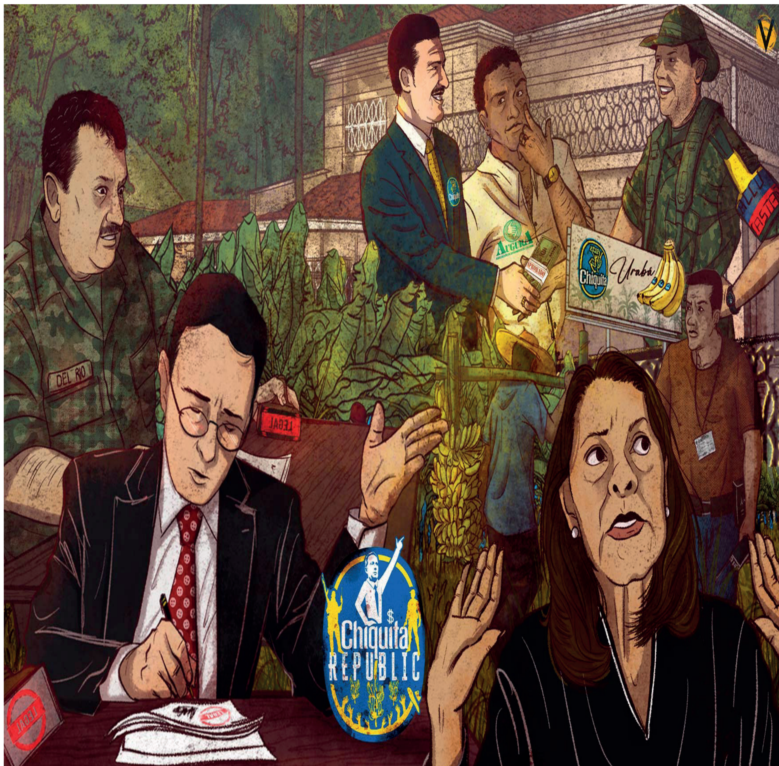
Urabá, los Paramilitares y Chiquita Brands.

Si estos crímenes prescriben, no habrá otra explicación que la falta de acceso a la justicia de las víctimas. Por ahora, quienes padecieron la violencia paramilitar impulsada por los empresarios tienen un triunfo a medias en el tortuoso camino de llevar a juicio a quienes financiaron las balas y a los hombres que dejaron ensangrentada a toda Urabá.