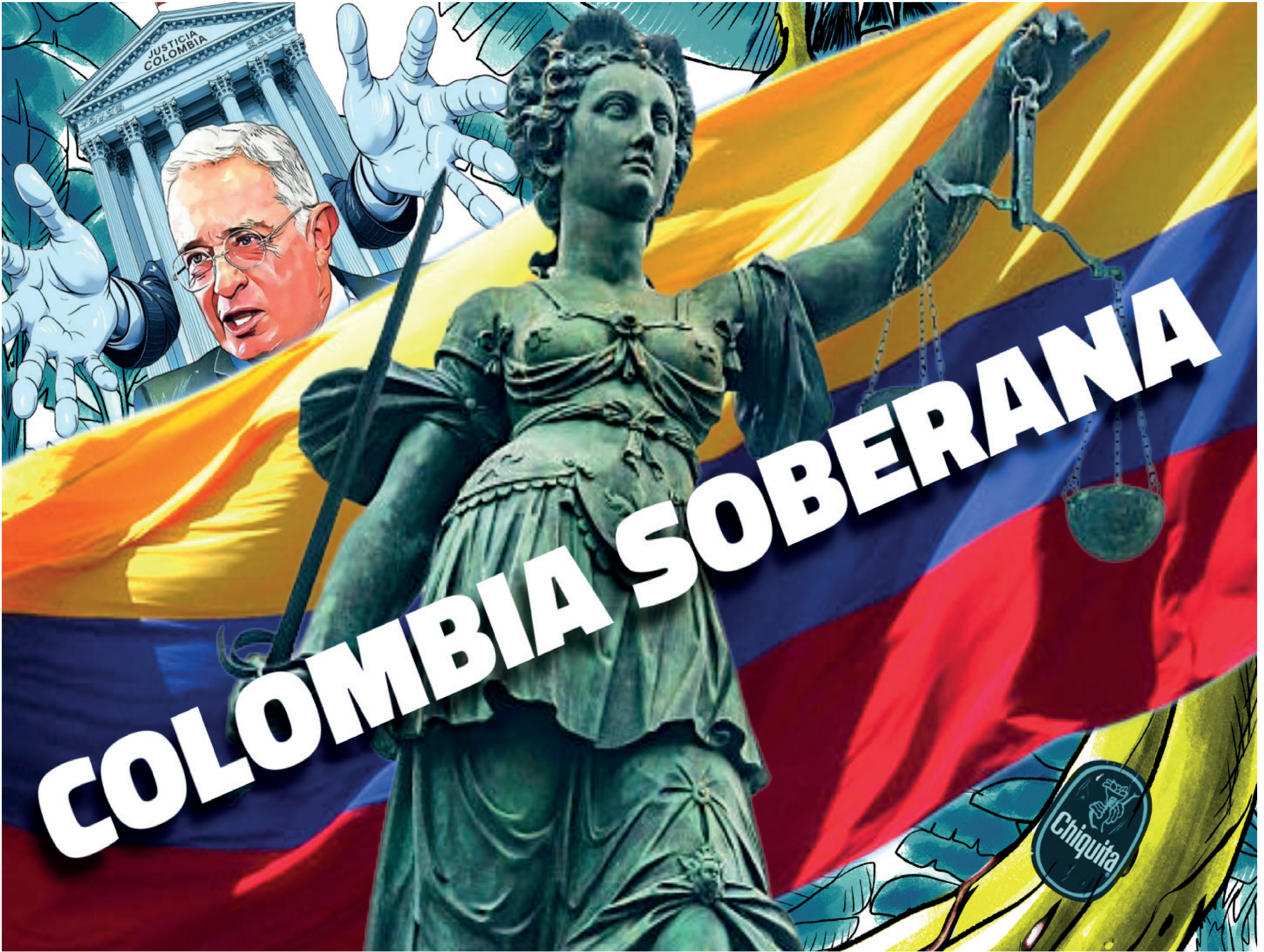
Ilustración Collagen imágenes tomadas de la web.

Edición No. 245 - Bogotá, D.C. Colombia - Julio de 2025 - ISSN 1900-0898 - cutbogotacun.org.co - www.cutbogotacund.org