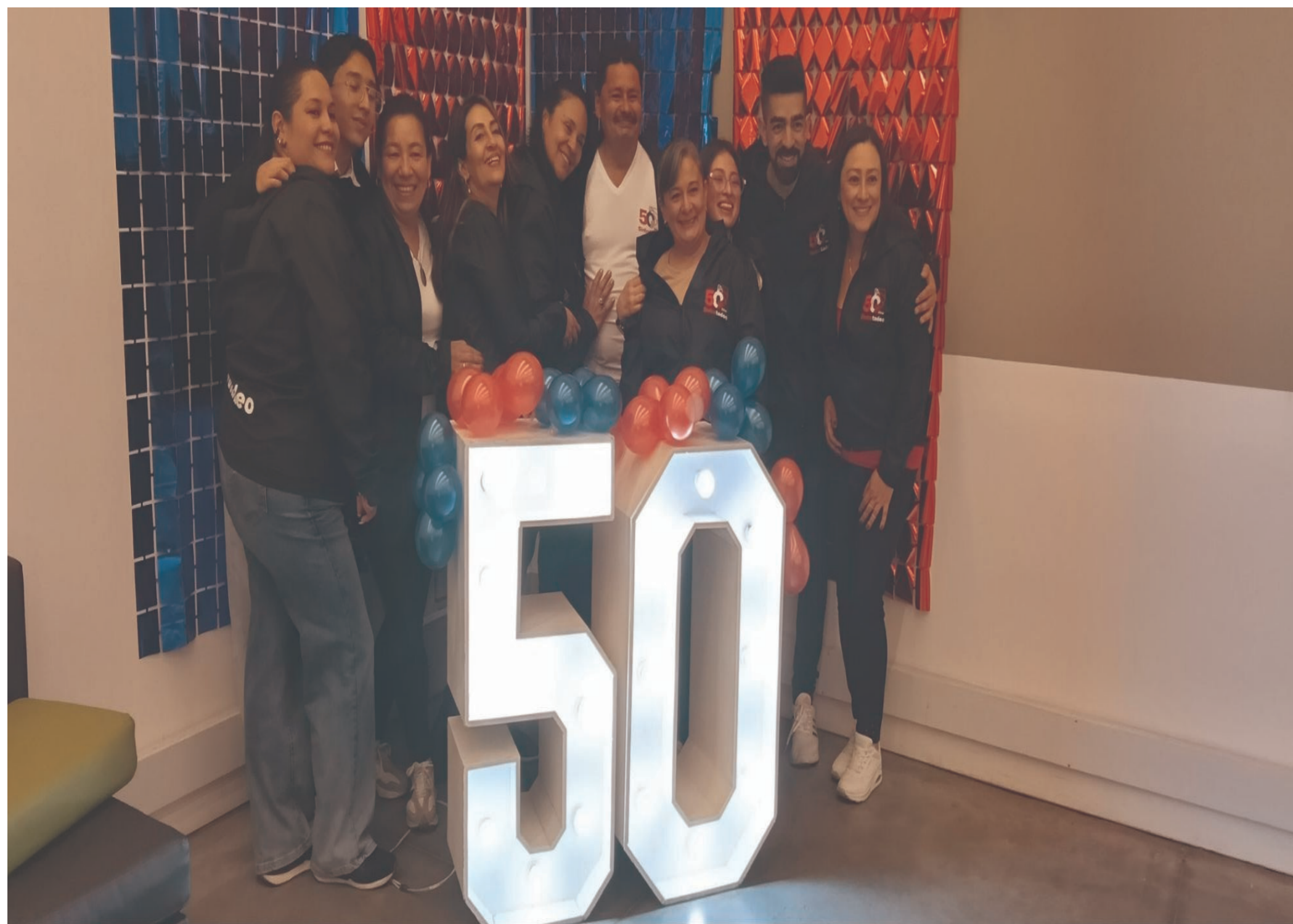
Celebración 50 años de Sintratadeo.

Cincuenta años de resistencia y dignidad: el legado de Sintratadeo