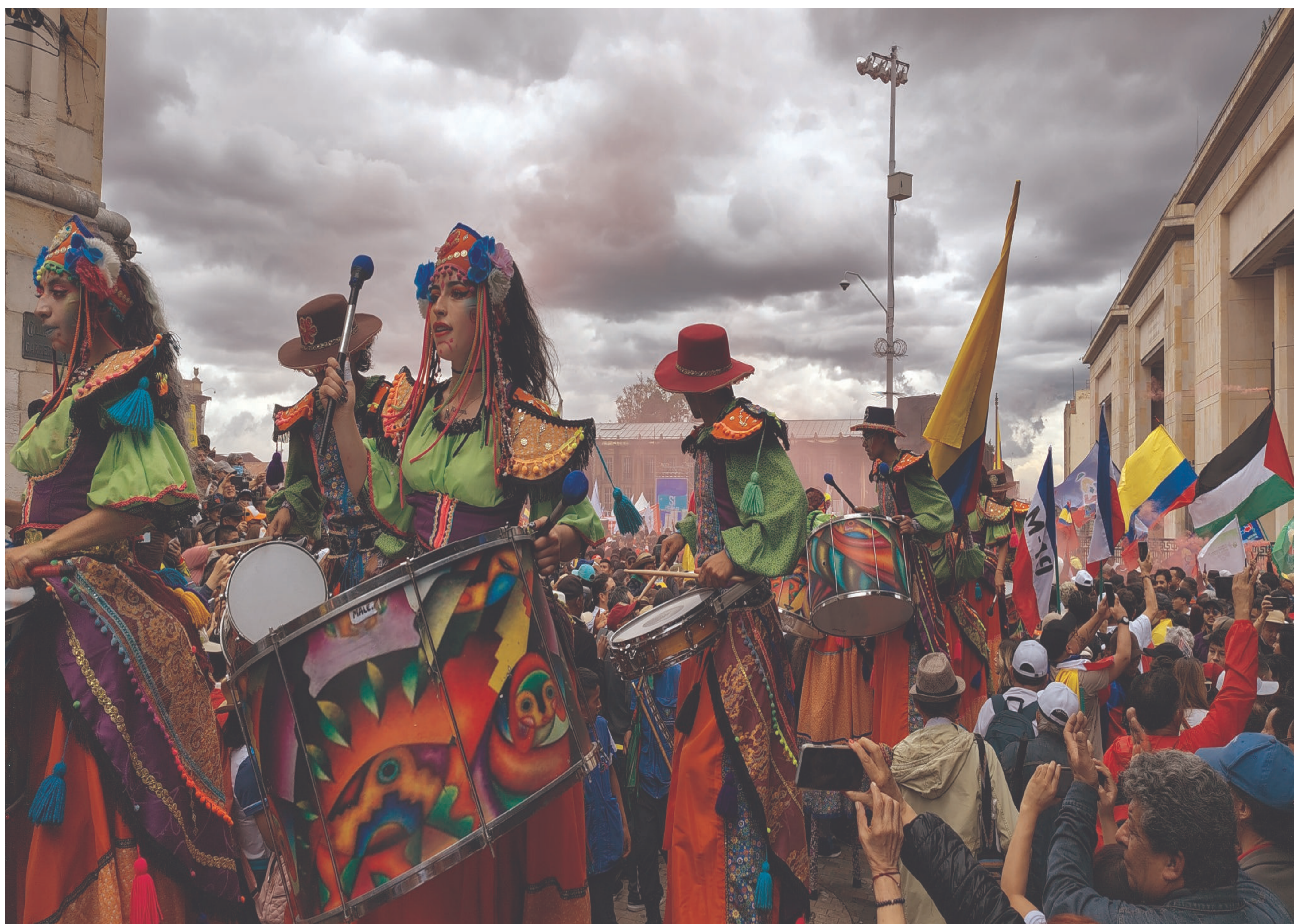
Artistas en la movilización del 1ero de mayo de 2025.

Edición No. 243 - Bogotá, D.C. Colombia - Mayo de 2025 - ISSN 1900-0898 - cutbogotacun.org.co - www.cutbogotacund.org