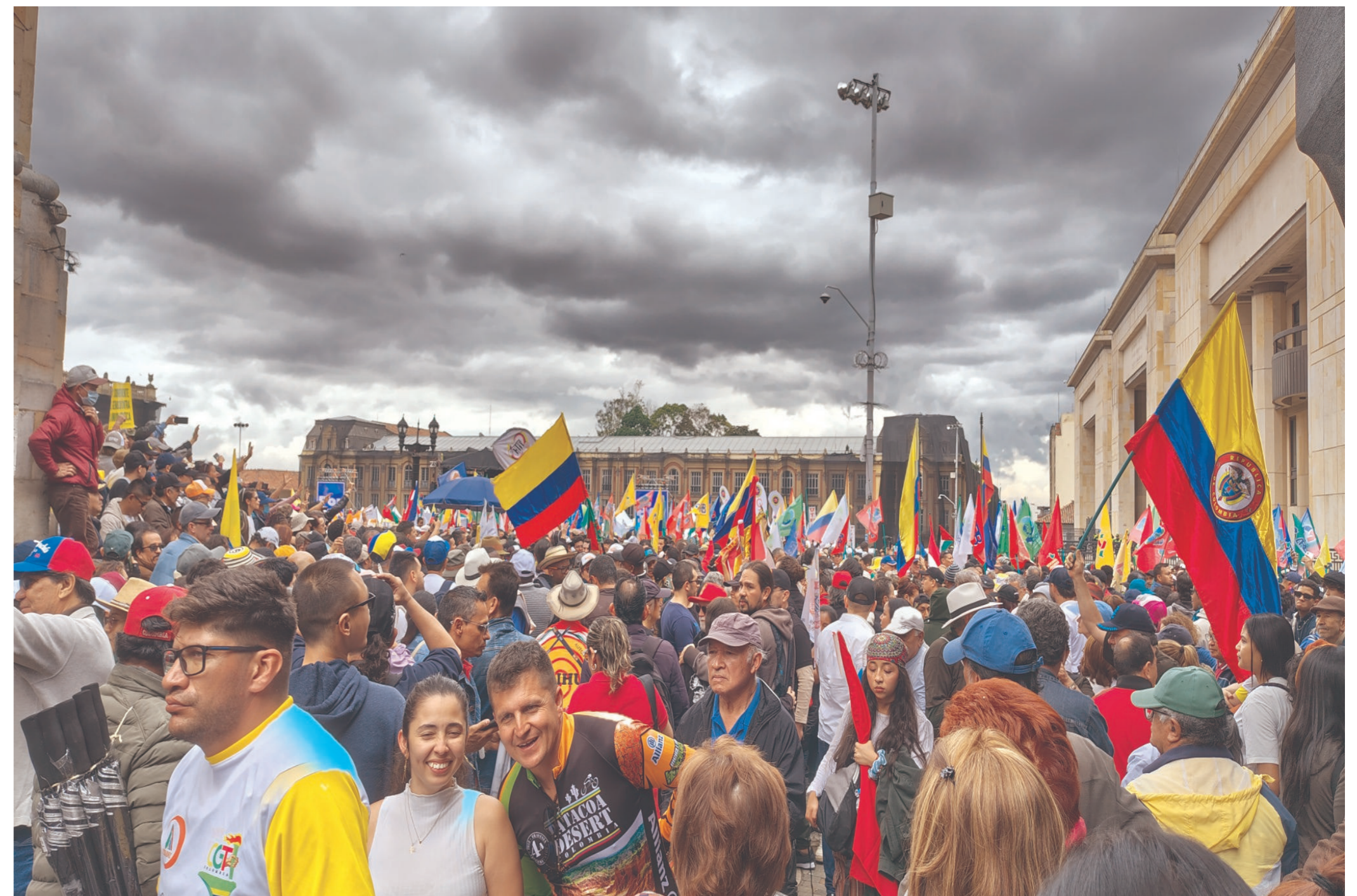
Plaza de Bolívar llena el 1ero de mayo de 2025.

La política se volvió gestión, los derechos beneficios, el estrado una empresa y la ciudadanía, clientela. El conflicto fue reemplazado por encuestas, quitaron el derecho a decidir: nos convencieron de que nada cambia, aunque decidamos.