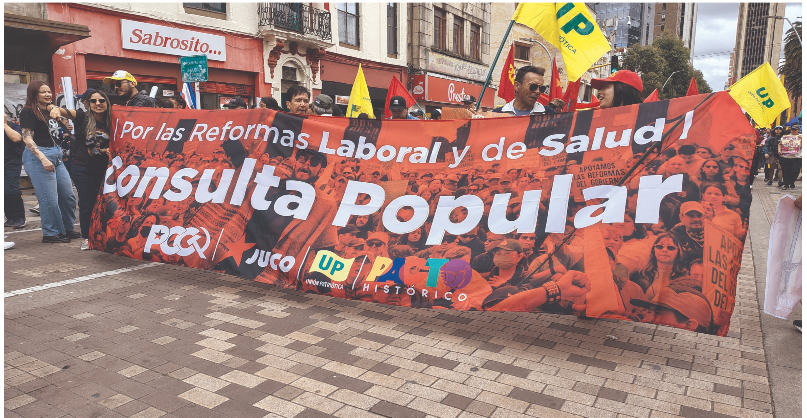
Asamblea ordinaria de SintraUPN.

En el caso que nos compete, debido al amaño de los ocho senadores y en esa coyuntura, el mecanismo es la Consulta Popular, que contiene 12 preguntas que abordan lo laboral. Esta fue presentada como iniciativa por el presidente de la República, Gustavo Petro Urrego, a mediados del mes de marzo, con el fin de que la ciudadanía decida sobre la Reforma Laboral en Colombia, además de los reiterados