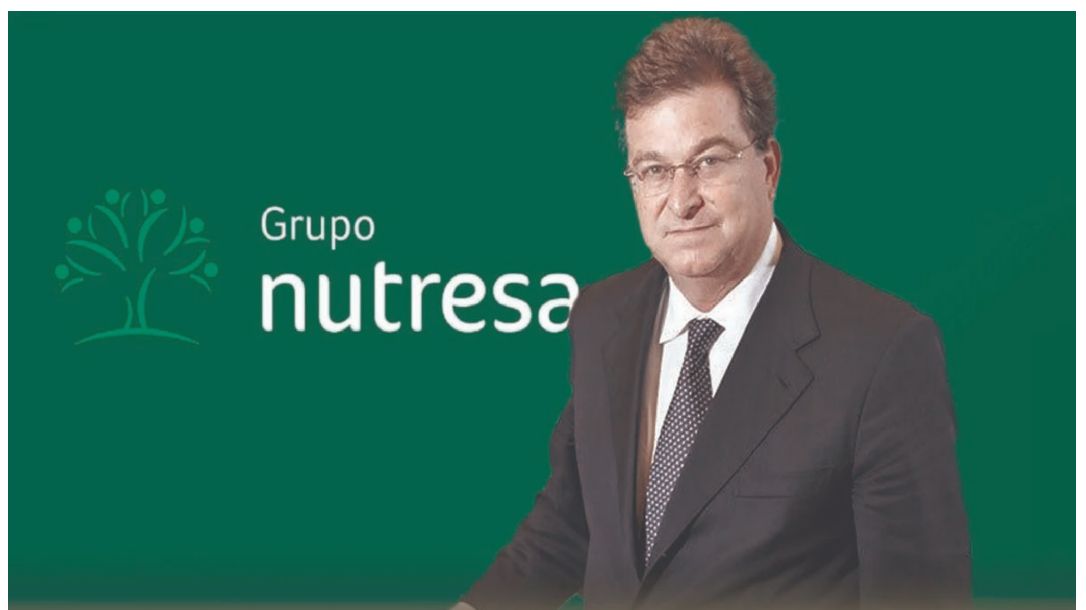
Jaime Gilinski.

Para Velasco, la estrategia es clara: reducir costos. “Desvinculan trabajadores con 15 o 20 años de experiencia, muchos con enfermedades laborales, y los reemplazan por mano de obra más barata”.