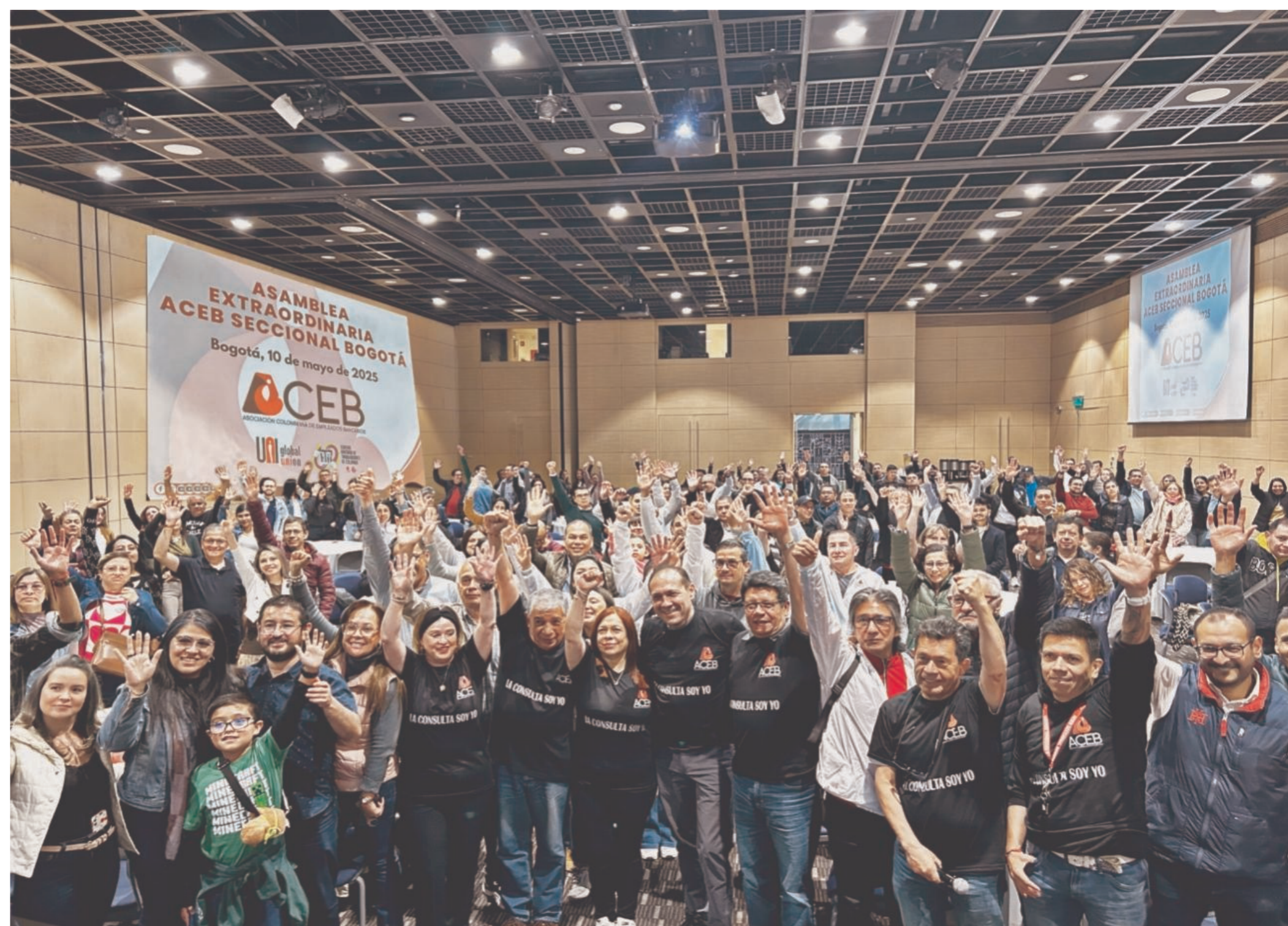
Asamblea General de ACEB 10 de mayo de 2025.

Durante el desarrollo de la asamblea, se discutieron problemáticas actuales como la imposición de metas comerciales inalcanzables y las prácticas laborales coercitivas que afectan gravemente la salud física y mental de los trabajadores bancarios.