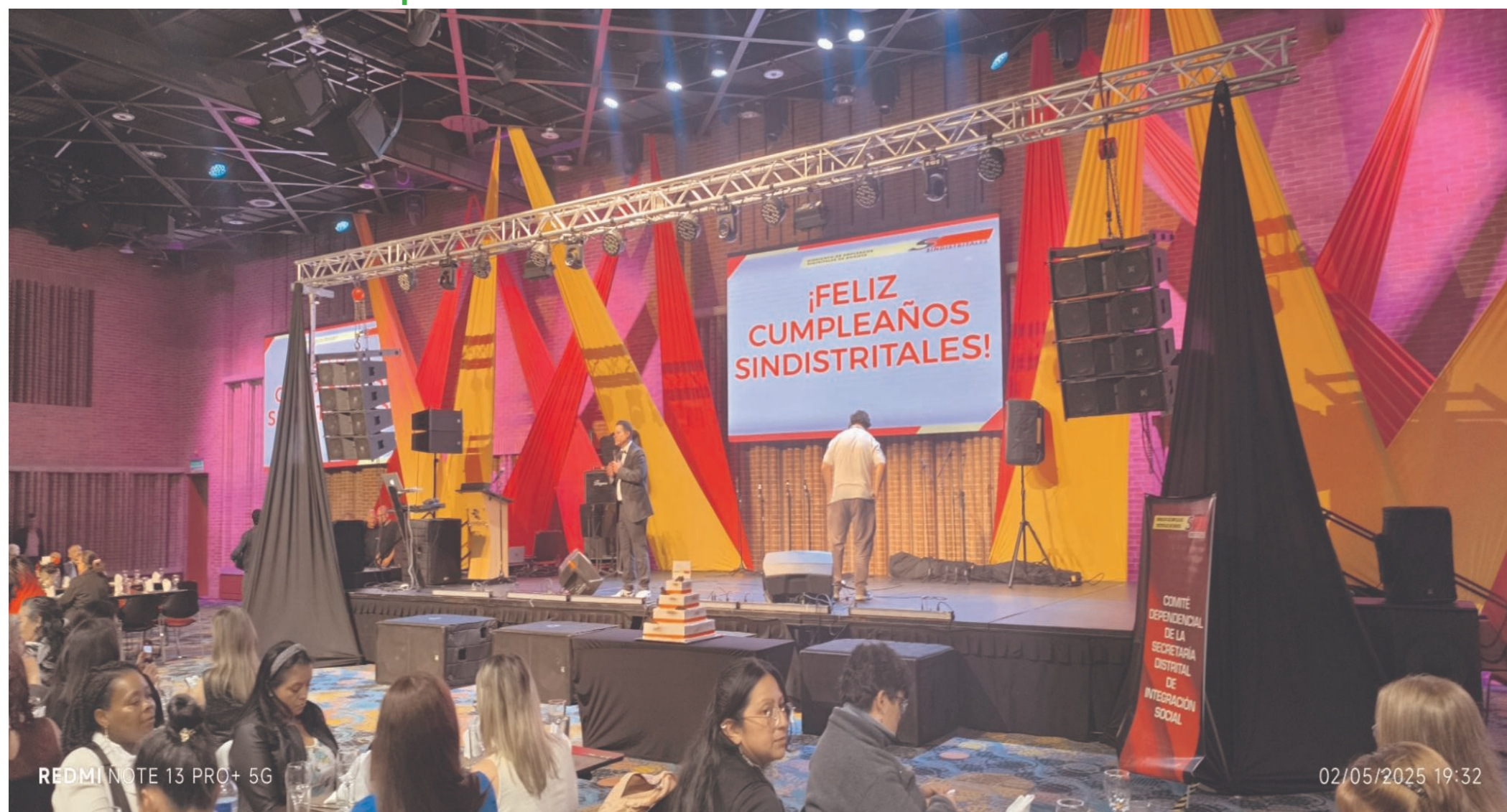
Celebración 90 años de Sindistritales.

El sindicato de empleados distritales de Bogotá - SINDISTRITALES conmemoró el pasado 02 de mayo del 2025, sus 90 años de lucha sindical, consolidándose como una de las organizaciones sindicales más emblemáticas del distrito Capital.